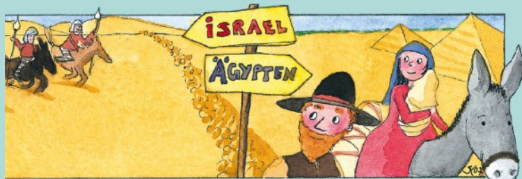
Aufsöng: Ein Engel.

aus der christlichen Kinderzeitschrift Benjamin