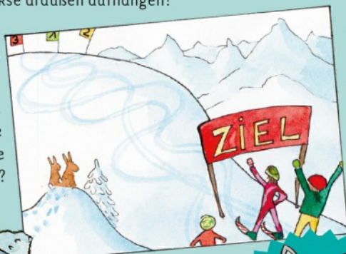
Der Skifahrer mit der Startnummer 1.

Rätsel: Wer ist im Rennen die kürzeste Strecke gefahren?